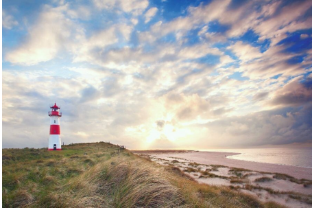
Nordfriesische Inselwelt - unser Klassiker

Nordfriesland - Sylt mit Hallig Hooge, Amrum und Föhr